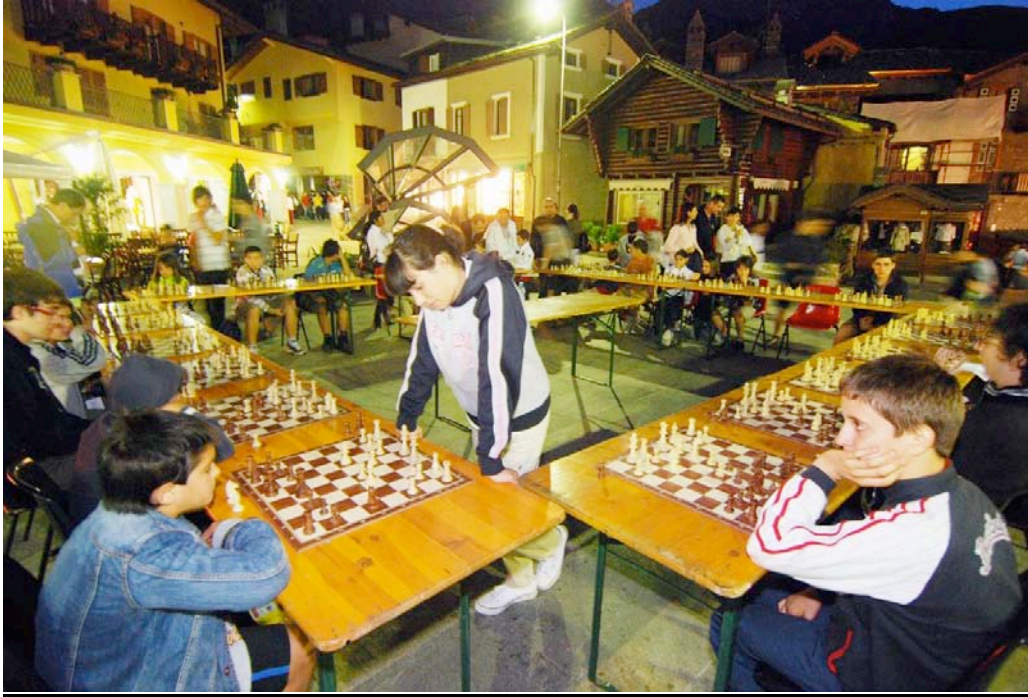
JARDIN DE L'ANGE